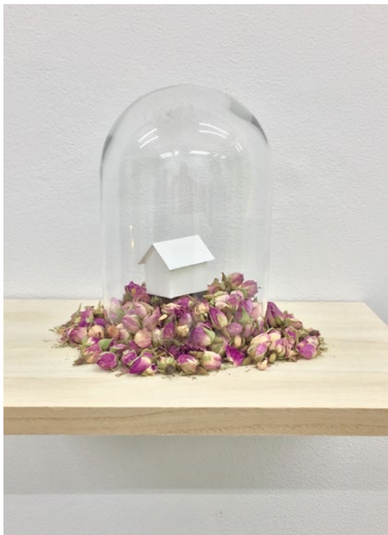
'Cuento las horas entre las flores' / 'Counting the hours amongst the flowers' Rosas de Damasco, papel, y cúpula de vidrio / Damascus Roses , paper, and glass dome 18 x 13 cm Pieza unica + 2 PA 2019