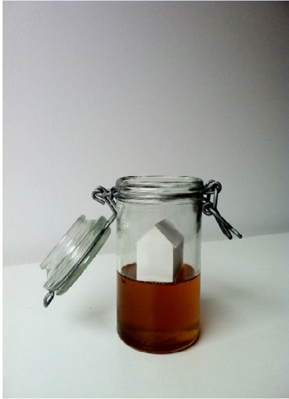
'Dulce Recuerdo' / 'Sweet memory' Miel, papel, frasco de vidrio / Honey, paper, glass jar 13 x 6 cm Pieza unica + 2 PA 2013