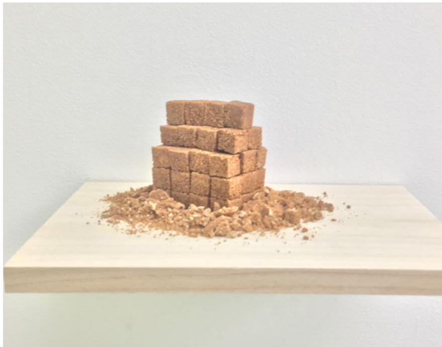
'En pedazos 2' / 'Crumbling into pieces 2' Panela / Raw sugar cane 12 x 20 x 16 cm Pieza única + 2 PA 2015