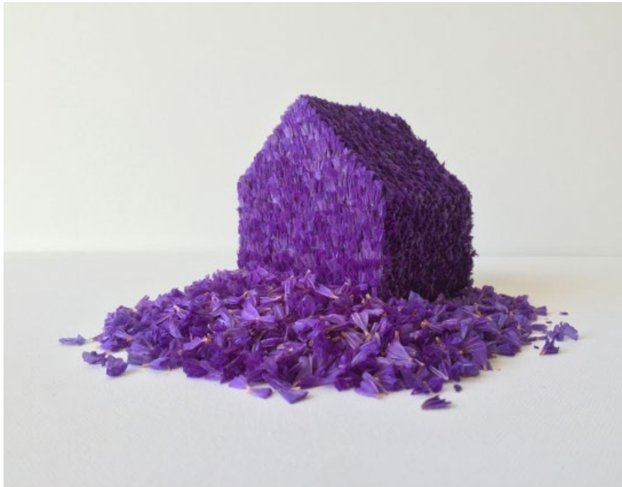
'Siempreviva' / 'Inmortal' Pétalos de Statice Sinuata (Lavanda de mar) y madera / statice petals (Sea Lavender) and wood. 10 x 14 x 12 cm Pieza única + 2 PA 2015