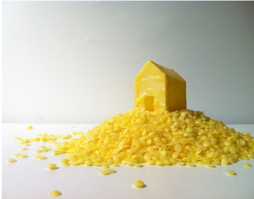
'Casa para Soñar' / ' House to dream' Cera de abejas / bees wax 14 x 25 x 28 cm Pieza única + 2 PA 2013