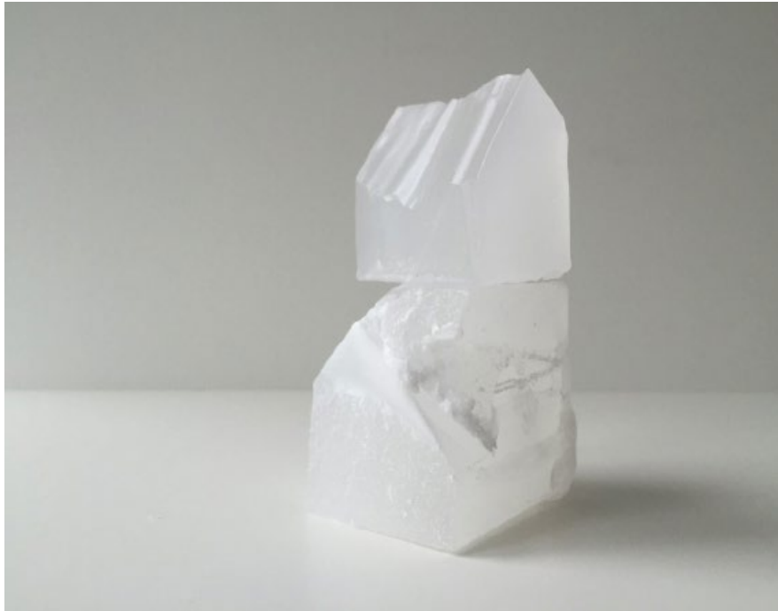
'Guarda memoria' / 'Mind Keeper' Parafina / Paraffin 12 x 7 x 6 cm Pieza única + 2PA 2015